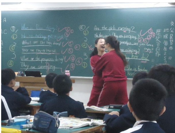
比手畫腳造句- "They are fighting!"