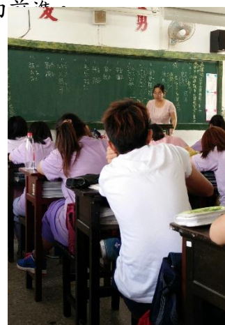
高二 x 班國文課