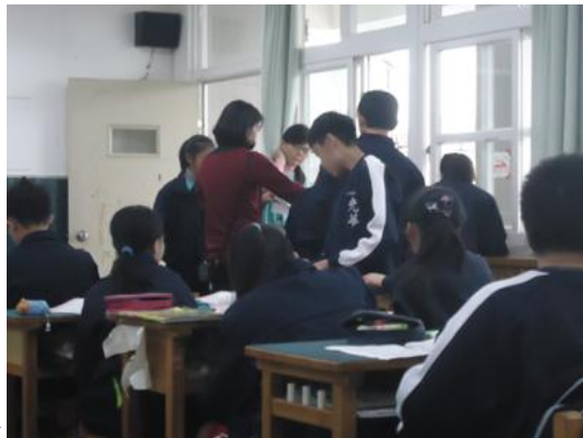
鄭老師親自輔導程度 C 的學生